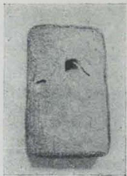
Fig. 435.—Llucena del Cid. Los Foyos. Pes de teler (1/4 apr.)

Pel demés, a l'època avançada de la cultura ibèrica a què pertany la torre de Llucena i Sant Antoni de Calaceit, sembla que degué ésser quelcom freqüent l'existència de semblants torres en els poblats. Al Baix Aragó s'en troba una altra al de «La Torre Cremada», en terme de la Vall del Tormo, essent els fragments de terrissa que s'hi recullen també ibèrics a torn pintats amb decoracions senzilles i, a més, ceràmica campaniana.